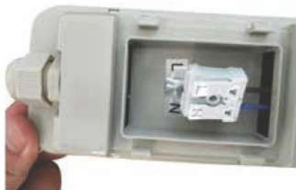
Connexion rapide à repiquage