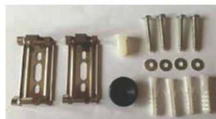
Accessoires de montage