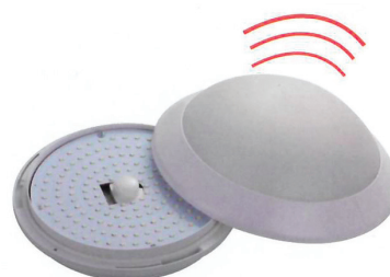
Avec détecteur de mouvement